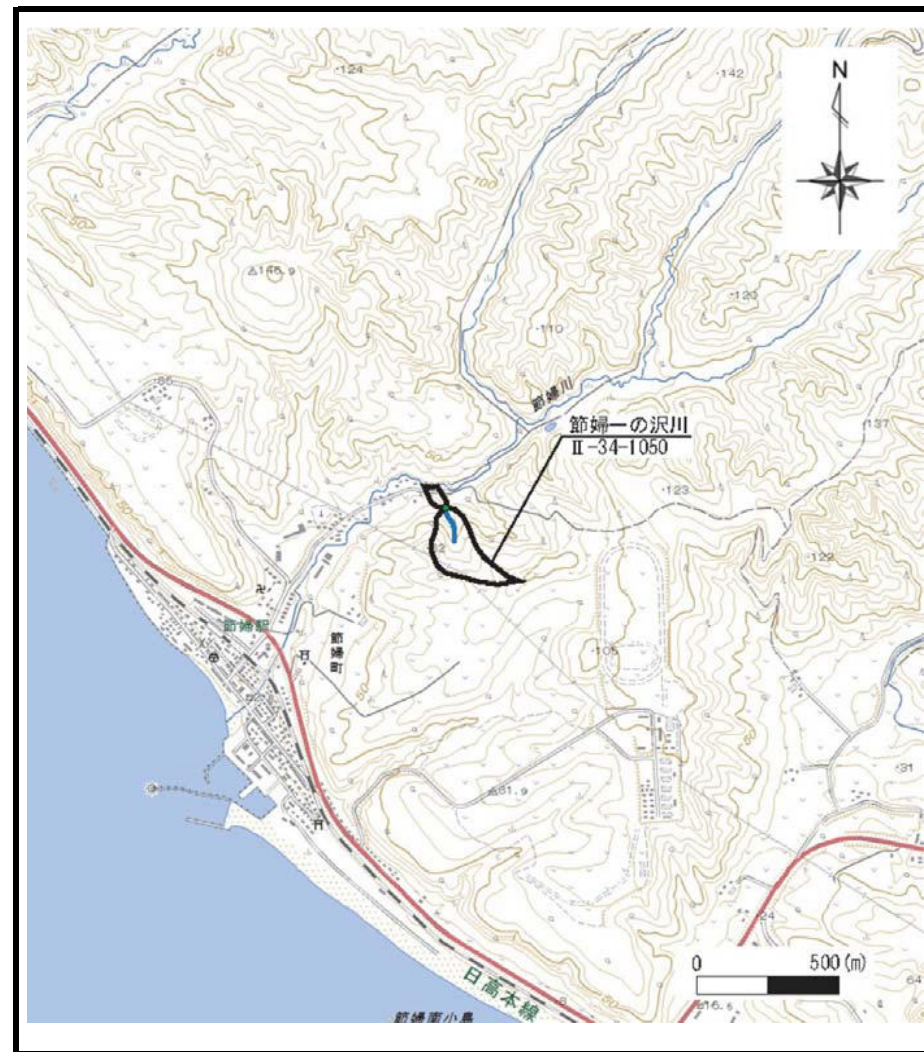
位置図 (1/25, 000)